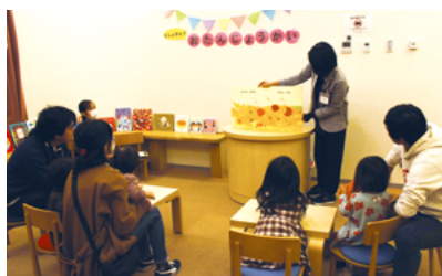
市民図書館での様子