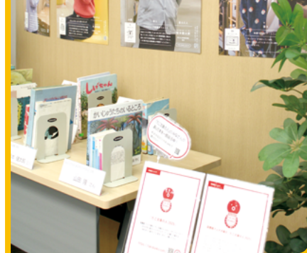
過去のイベントの様子、イメージ写真