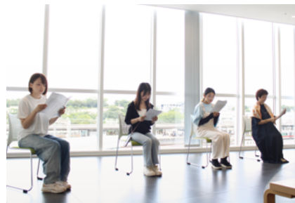
学生による公演の様子（9/20）