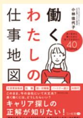
請求記号 366.3 コハ