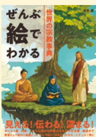
せいきゅうきどう 請求記号 160 マサ