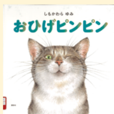
せいきゅうきどう 請求記号 PN シ