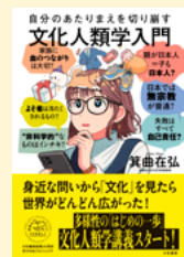
せいきゅうきごう 請求記号 389 ミノ