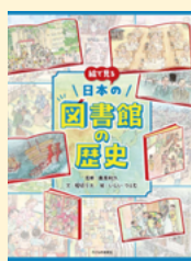
せいきゅうきごう 請求記号 01 ホ