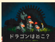
せいきゅうきごう 請求記号 PG テ